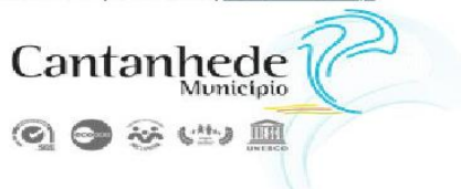
Figura 8. Divulgação do período de discussão pública – solicitação às Juntas de Freguesia para divulgação do Edital

231410100 | 231410154 | cm-cantanhede.pt