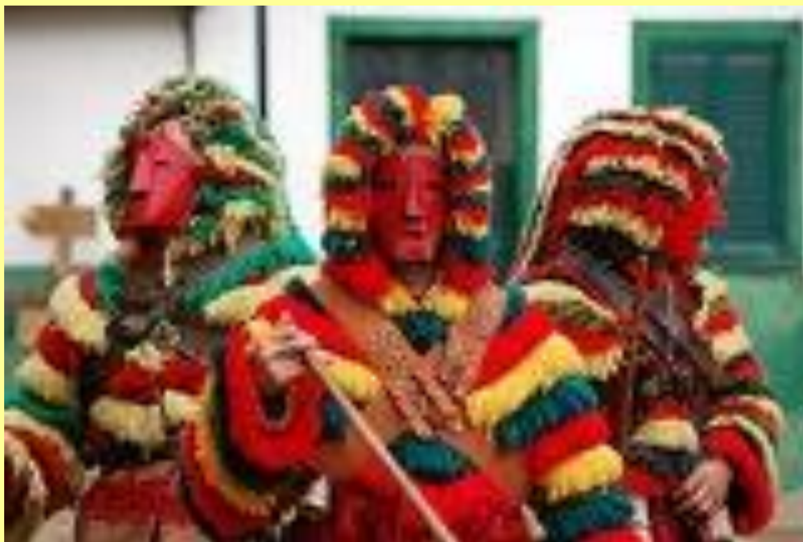
Caretos no Carnaval de Podence (Trás-os-Montes e Alto Douro).