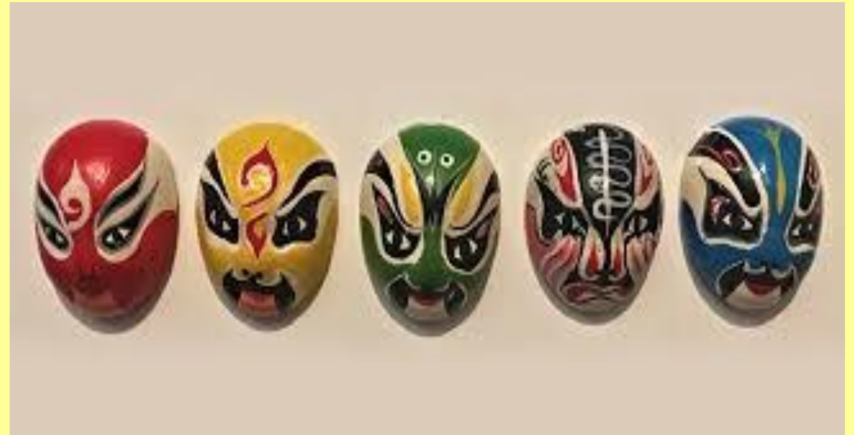
Máscaras usadas na óperas Chinesas

Na China as máscaras eram usadas para afastar os maus espíritos. Atualmente usam-se nas óperas.