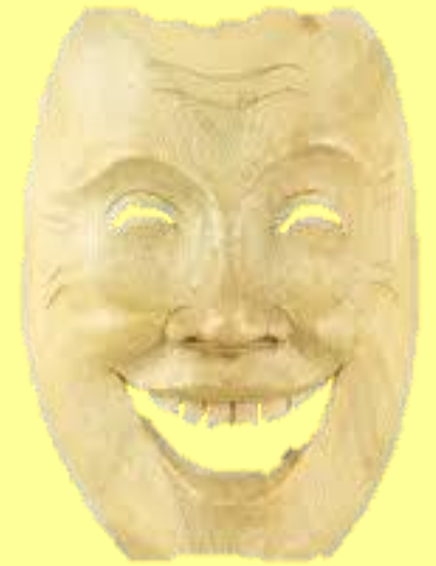
Máscara de teatro Grécia