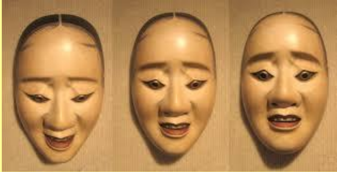
Máscaras atuais do Japão

No teatro japonês No , que mistura canto, pantomina, música e poesia, também se usam máscaras. Estas são confeccionadas em madeira, revestidas de gesso e pintadas de acordo com o seu significado