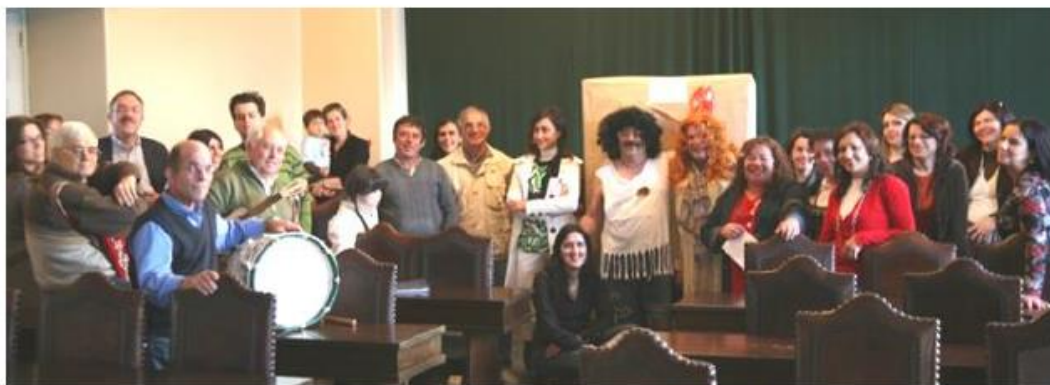
Boletim Informativo de maio de 2008