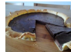
“Tarte de Chocolate Brownie”

Ingredientes: Massa Quebrada - 1 Rolo; Chocolate de Cozinha - 130gr; Manteiga - 200gr; Ovos - 3 L; Açúcar - 220gr; Amêndoas - 120gr; Farinha - 100gr; Sal - Um pitada