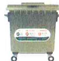
TABELA DE TARIFAS E PREÇOS 2021