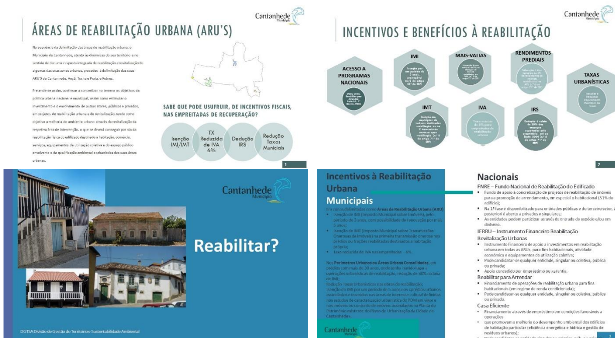
Figura 2. Folhetos de divulgação das ARU aprovadas no concelho de Cantanhede e dos incentivos à reabilitação urbana

Assim, nesta fase foi dado especial enfoque ao incentivo e apoio aos proprietários para a promoção da reabilitação dos seus edifícios. Ao longo dos três primeiros anos de execução da ORU foi prioritário proceder à divulgação e promoção das condições e vantagens subjacentes à reabilitação dos edifícios, sensibilizando-os para a manutenção da qualidade urbanística da cidade e eliminação de dissonâncias.